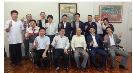
6 回生キャリアガイダンスにて